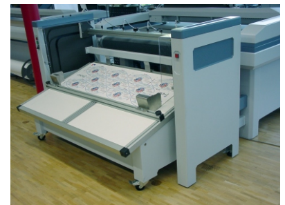
Pick and Place Modul mit Ladetisch